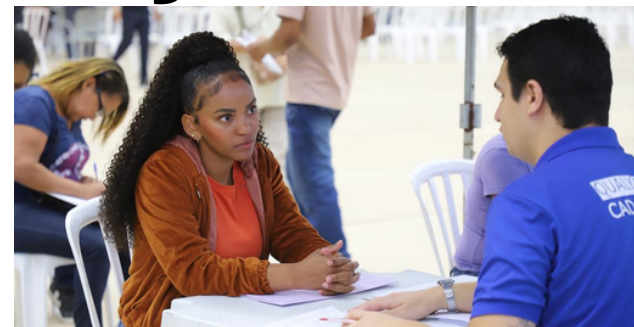
Serão mais de 1.800 vagas em diversos segmentos, incluindo oportunidades para PCDs

Entre os destaques estão 241 vagas destinadas a Pessoas com Deficiência (PCD), oportunidades para Jovem Aprendiz e salários que podem chegar a R$ 4,5 mil. A maior parte das vagas não exige experiência profissional, contemplando candidatos em busca do primeiro emprego ou de uma nova oportunidade.