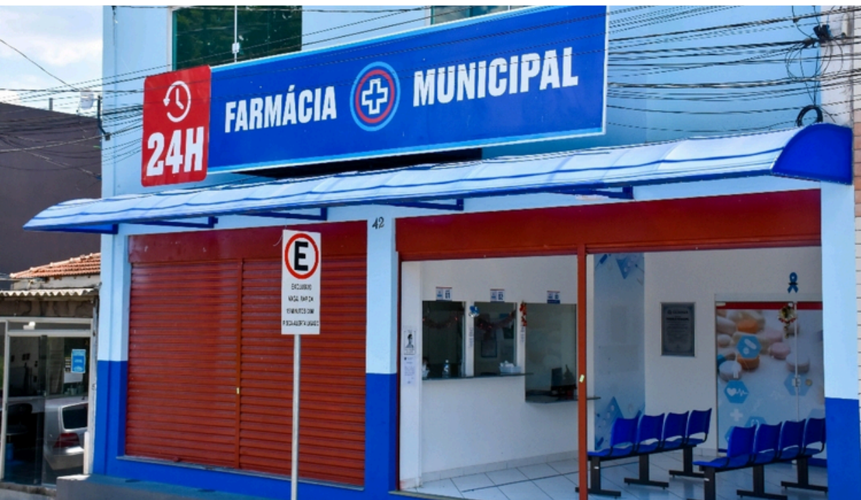
A partir de 1º de julho pacientes de Cajamar poderão realizar o cadastro e retirar medicamentos de alto custo diretamente nas farmácias municipais de Jordanésia e Polvilho

Pacientes poderão realizar cadastro e retirar os medicamentos nas farmácias municipais de Cajamar