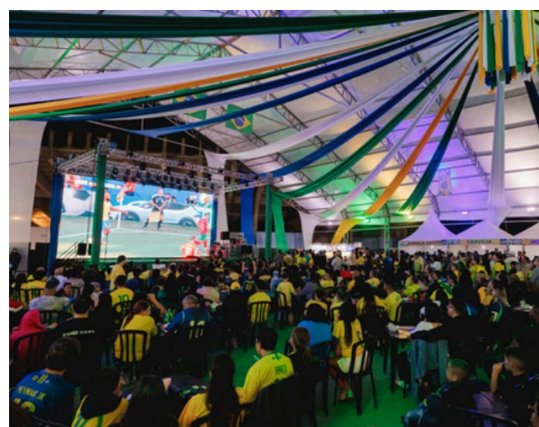
Primeira transmissão da Seleção Brasileira reuniu famílias, atrações culturais e torcida

Milhares de pessoas participaram da festa organizada pela Prefeitura de Cajamar no Centro de Eventos Boiódromo para acompanhar a estreia da Seleção Brasileira na Copa do Mundo. O público contou com uma programação especial, incluindo apresentações de artistas locais, praça de alimentação, pintura facial, troca de figurinhas e distribuição gratuita de pipoca, antes da transmissão da partida em um telão gigante.