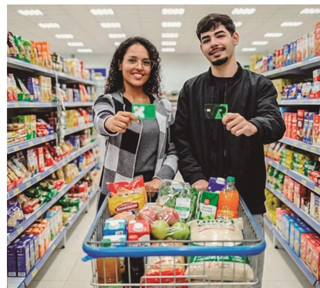
Os cartões já foram entregues para os colaboradores na última semana

O prefeito de Santana de Parnaíba, Elvis Cezar, ampliou os valores do benefício Vale Cesta Básica por meio da Lei nº 4.501/2026, reforçando a valorização dos servidores públicos municipais. Os novos valores variam entre R$ 400 e R$ 650, de acordo com a categoria profissional, beneficiando trabalhadores de diversas áreas da administração.