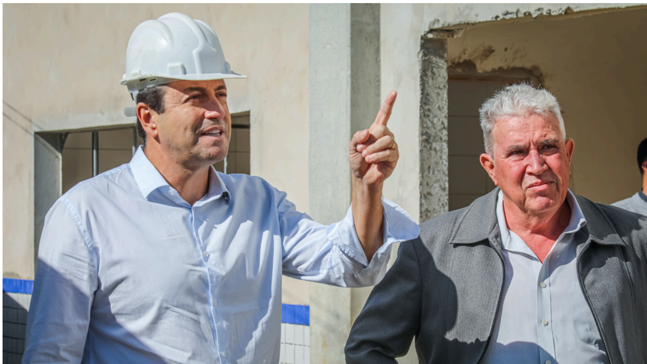
Nova base da Polícia Militar avança em Santana de Parnaíba e reforçará a estrutura de segurança pública do município com mais agilidade e presença policial

As obras já estão em andamento e atualmente se encontram na fase de alvenaria, com cerca de 10% da construção concluída. A nova unidade contará com uma área total de 749,81 metros quadrados, oferecendo estrutura ade-