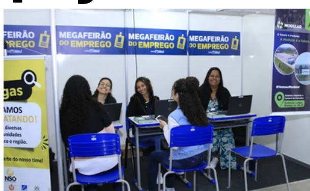
O evento reunirá vagas em diversas áreas para quem busca oportunidades

Os participantes poderão concorrer a vagas em diversas áreas, incluindo Jovem Aprendiz, Produção, Logística, Administrativo, Vigilante, Coordenador, Líder e Fiscal de Prevenção, entre outras. A orientação da organização é que os candidatos compareçam ao local com currículo atualizado para participar dos processos seletivos e aproveitar as oportunidades.