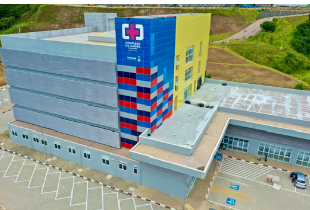
Reconhecimento da ONA atesta a excelência, a segurança e a qualidade dos atendimentos

O Complexo de Saúde de Cajamar conquistou o selo de qualidade da Organização Nacional de Acreditação (ONA), certificação reconhecida internacionalmente que atesta a excelência, a segurança e a organização dos serviços prestados à população. O reconhecimento confirma que a unidade atende rigorosos padrões de qualidade, fortalecendo a confiança dos pacientes atendidos pela rede municipal. A estrutura reúne serviços como CER II,