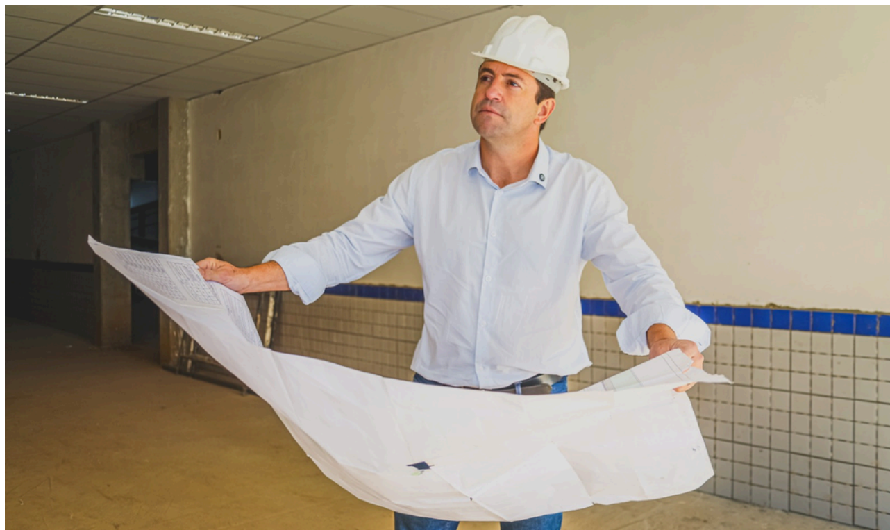
Prefeito de Santana de Parnaíba, Elvis Cezar, acompanha o avanço das obras de duas novas UBSs nos bairros 120 e Jaguarí, que vão reforçar a saúde

As novas unidades contarão com consultórios médicos, atendimentos de enfermagem e serviços preventivos, fortalecendo a rede municipal de saúde. A iniciativa integra as ações da Prefeitura voltadas à expansão da infraestrutura e à melhoria contínua dos serviços públicos oferecidos aos moradores de Santana de Parnaíba.