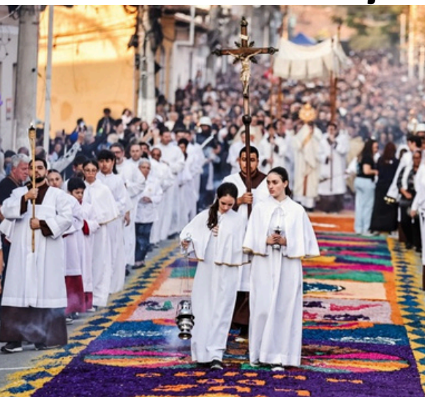
Corpus Christi celebra 66 anos de fé, tradição e união no Centro Histórico

Santana de Parnaíba viveu mais uma emocionante celebração de Corpus Christi, reunindo milhares de pessoas em um momento marcado por fé, tradição e união entre famílias. A cidade foi palco de uma das manifestações religiosas mais importantes do município, que mais uma vez atraiu moradores e visitantes para o Centro Histórico. Há 66 anos, os tra-