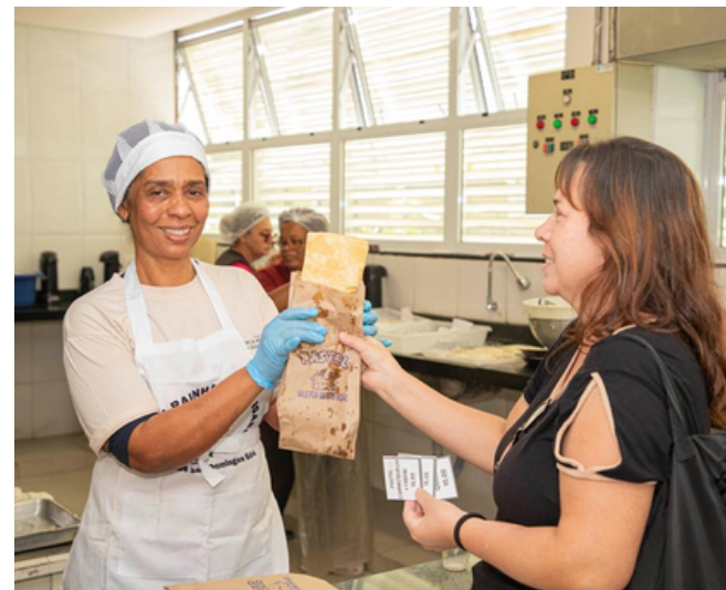
O evento vendeu 317 itens e reuniu a comunidade em uma ação solidária

A Secretaria dos Direitos da Pessoa com Deficiência de Barueri (SDPD) realizou a segunda edição do Festival do Pastel de 2026, reunindo servidores, usuários da secretaria e moradores da cidade em uma ação solidária. O evento aconteceu na sede da pasta, no Jardim Belval, e ofereceu pastéis de diversos sabores, além de combos com refrigerante e a opção de compra de pastéis crus para preparo em casa.