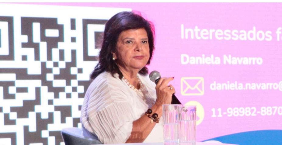
Heloísa Trajano, empresária e referência no empreendedorismo brasileiro, vai participar do Seminário LIDE em Barueri

A Secretaria de Indústria, Comércio e Trabalho de Barueri (Sict) confirmou a realização do Seminário LIDE – Empreendedorismo e Economia Criativa, que acontece no dia 16 de junho, na Praça das Artes, das 8h às 12h. O evento reunirá representantes do setor público, empresarial e da economia criativa para debater tendências e oportunidades de desenvolvimento econômico.