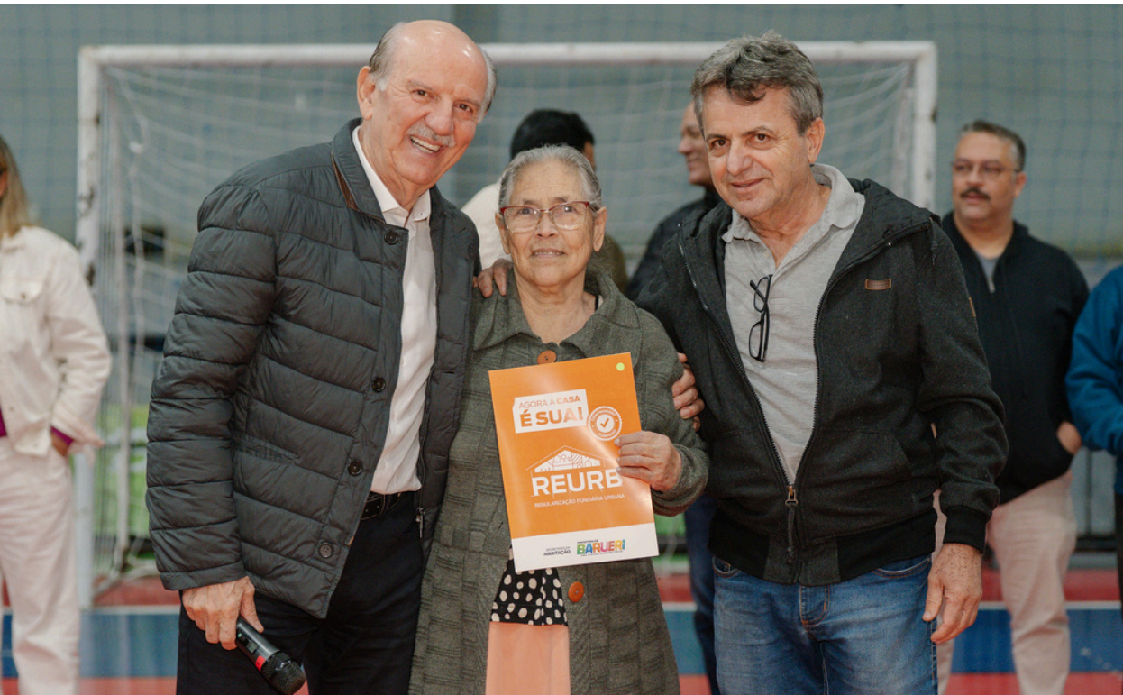
Beto Piteri ao lado de moradores do Conjunto Habitacional Aníbal Correia, durante a entrega de títulos de propriedade, garantindo segurança jurídica

Prefeito de Barueri reforça avanço da regularização fundiária e amplia segurança jurídica para famílias