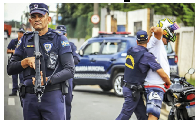
GCM de Santana de Parnaíba age rápido e evita tragédia em caso de violência doméstica

suspeito tentou fugir ao perceber a chegada das equipes, sendo capturado em seguida. Com ele, os guardas apreenderam um revólver calibre 38 carregado e com numeração suprimida. O homem foi preso em flagrante e encaminhado à Delegacia de Defesa da Mulher (DDM) de Barueri. A ação reforça o trabalho da GCM no combate à violência.