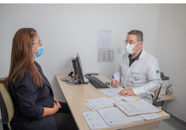
As ausências sem aviso prévio impedem o aproveitamento das vagas por outros pacientes

A rede municipal de saúde de Barueri registrou mais de 70 mil faltas em consultas e exames entre janeiro e abril de 2026. No período, foram realizados 271.581 agendamentos, sendo 169.863 para exames e 101.718 para consultas. No entanto, 39.431 pacientes não compareceram aos exames e 31.491 faltaram às consultas, gerando impacto direto no atendimento à população.