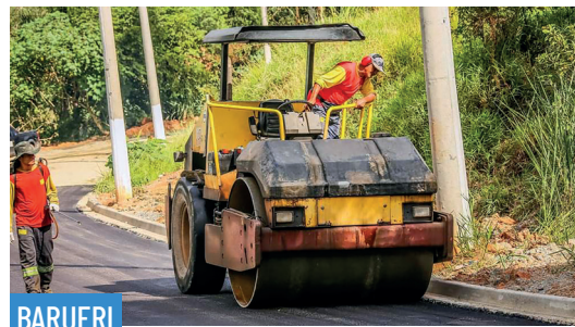
BARUERI Ingaí e Sítio do Morro recebem obras de pavimentação asfáltica • PAG 7