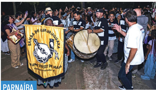
PARNAÍBA 137ª Festa do Cururuquara reuniu apresentações de grupos de samba • PAG 7