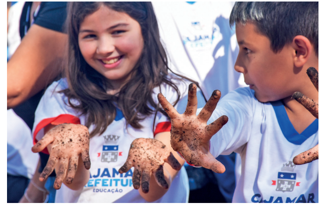
O intuito do projeto é promover a integração

A Secretaria do Meio Ambiente, em parceria com a Secretaria de Educação, na última sexta-feira, 17 de maio, realizou mais uma edição do Projeto Semeia Cajamar, dessa vez na EMEB Demétrio Rodrigues Pontes, localizada no bairro Ponunduva. O evento foi marcado por atividades educativas que enfatizaram a importância dos alimentos naturais e promoveram o contato das crianças com a terra. O Projeto Semeia Ca-